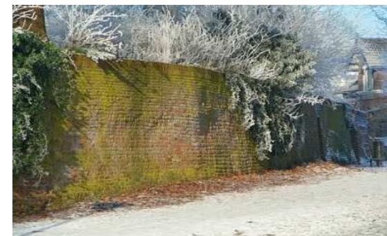
De stadsmuur aan het Tockpark, aansluitend op de voormalige Latijnse School

Loop langs de stadsmuur, buig dan af naar links het voetgangersbruggetje over. Hier loopt het Spijk. Keer terug en vervolg uw weg langs de stadsmuur.