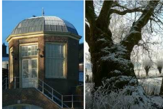
Theekoepel op oude muurtoren en de oudste plaataan van Gelderland (?)

Volg het Wallepad langs de stadgracht. Loop verder langs stadgracht en stadsmuur. Aan de overkant van de gracht ligt de Grebbedijk. Aan het einde van de stadsmuur rechts ziet u de theekoepel. Volg het pad verder langs de stadgracht, en loop de trap op. U bevindt zich op het persgemaal op de plaats van het vroegere Rhijnbolwerk. Loop aan de noordkant het persgemaal weer af, en loop door het Emmapark verder langs de gracht.