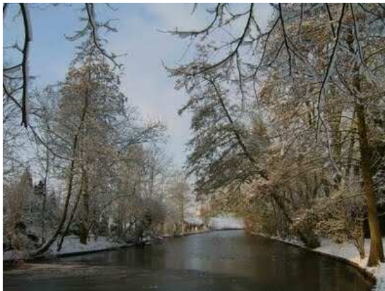
De stadgracht tussen Bowlespark en Grebbedijk

Loop rechtdoor aan het einde van de stadsmuur. U komt uit op de kasteelmuur met opgegraven torenfundament. Ga rechtsaf, en loop langs de kasteelmuur. Aan het einde van de kasteelmuur bevindt zich een tweede torenfundament. Ga de trap op tussen de twee pilaren. Rechts is het museum De Kasteelse Poort. Tegenover u ligt het Bowlespark. Steek de straat over schuin naar rechts, en loop het Wallepad op.