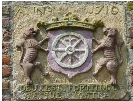
De oude gevelsteen in de Nudepoort

Vanaf het Emmapark komt u op het Nudebolwerk uit. Bekijk de muurvegetatie op het bolwerk aan het water. Loop dan even de brug over om het bolwerk vanaf de overkant te bekijken. Keer dan terug, en loop het bolwerk aan de overkant van de Nude even op. Vervolg dan uw weg langs de gracht.