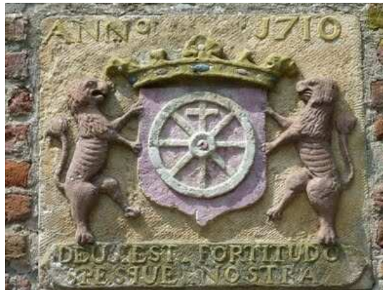
De oude gevelsteen in de Nudepoort

Vanaf het Emmapark komt u op het Nudebolwerk uit. Bekijk de muurvegetatie op het bolwerk aan het water. Loop dan even de brug over om het bolwerk vanaf de overkant te bekijken. Keer dan terug, en loop het bolwerk aan de overkant van de Nude even op. Vervolg dan uw weg langs de gracht.